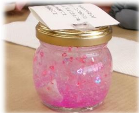
保冷材で作る消臭剤 キラキラしてカワイイ♪