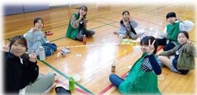
おしゃべりしながら食べる お弁当は格別！

ジュニアリーダーや青少年指導委員が用意したレクリエー ションはどれも大好評で、笑顔あふれる研修になりました。