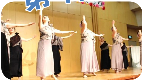
素敵な踊りと演奏に魅了されました