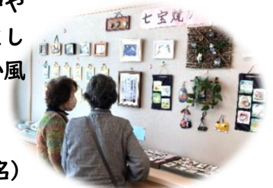
作品を観ながら 楽しいひととき