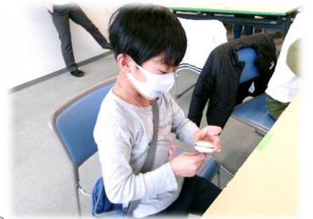
木製のヨーヨーに 絵を描くよ