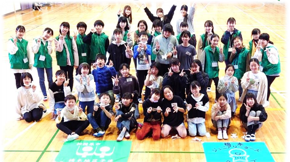
楽しかったね！次の研修会も頑張ろうね！