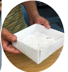
橋本高校の皆さんは 使用済みの点字用紙で箱作りを教えてくださいましたよ♪