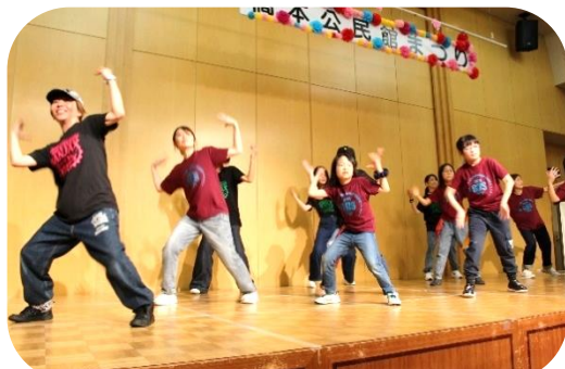
観客のみんなもノリノリでした (*~*)