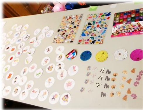
オリジナルな缶バッチも作ったよ