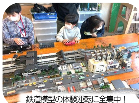
鉄道模型の体験運転に全集中！ 気分は運転士、「出発進行！」