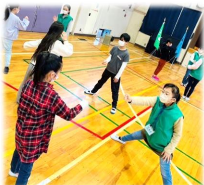
ジャンケンに負けたら足を開くよ！ 立てなくなったら負け♪