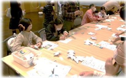
↑紙飛行機を作って～ ↓的を狙って飛ばす！