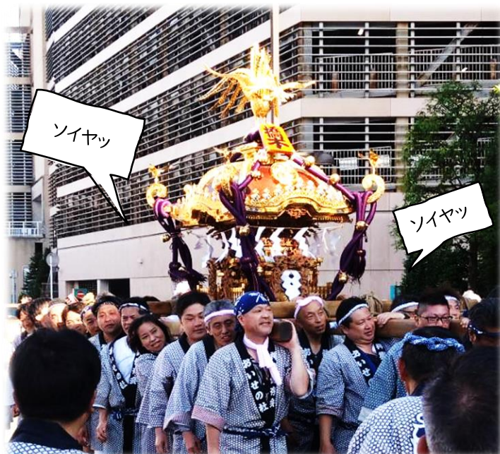
【八坂神社 例大祭】 大人の本気のお神輿、カッコイイ!!