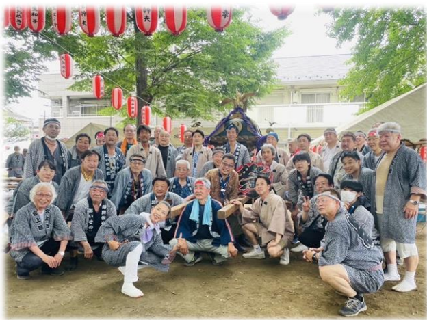
【宮上本町のお祭り】

宮上の自治会だけでは高齢化で担ぎ手が足りなくて、橋本の神輿会と初めて協力して担ぎました