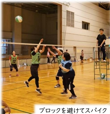
ブロックを避けてスパイク

毎年恒例となっている2つのバレーボール親睦大会では、参加者の皆様が楽しく!本気で!?バレーをし、良い汗をかいていました。