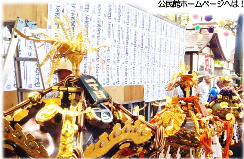
【神明大神宮 例大祭】