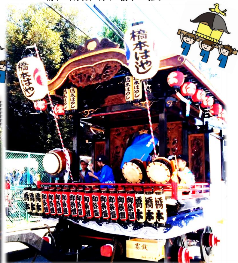
【八坂神社 例大祭】橋本連合の各自治会を山車が巡ります 休憩所ではその地区の子どもたちが連合の太鼓をたたかせてもらいました