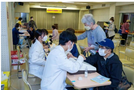
大人気の健康チェック！日頃から健康に気を使っている方が多いことに感心しました