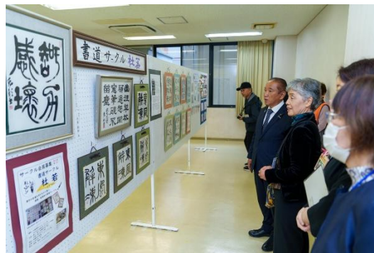
力作ぞろいの作品に市長も称賛！