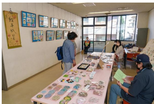
展示と手作り品販売のコラボ