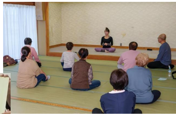
ヨガ体験で、心と体がすっきり！