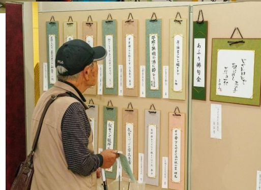
思わず見入ってしまった展示