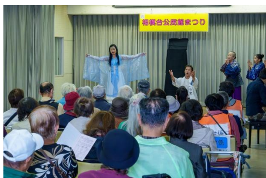
会場内に響く声、素晴らしかったオペラ