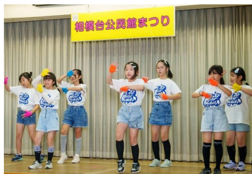
元気をもらったキッズダンス！