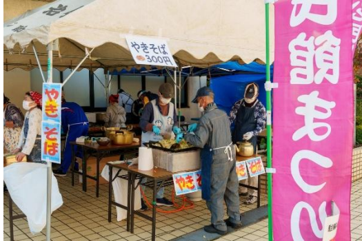
2日間の食べ比べで焼きそばを堪能