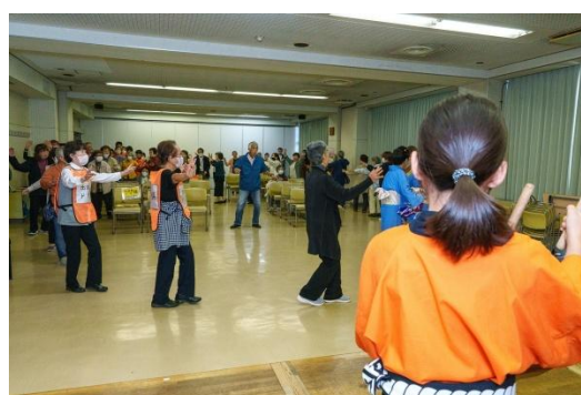
70周年を記念して、来場者と盆踊りで フィナーレ