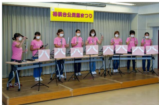
癒されたトーンチャイムの優しい音色