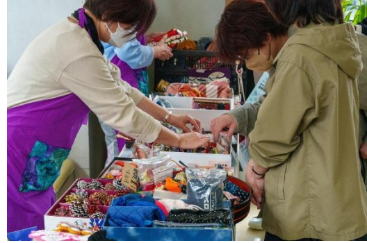
手作り品は来場者の人気