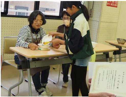
70カウントに挑戦！では17名が達成し、賞状を授与