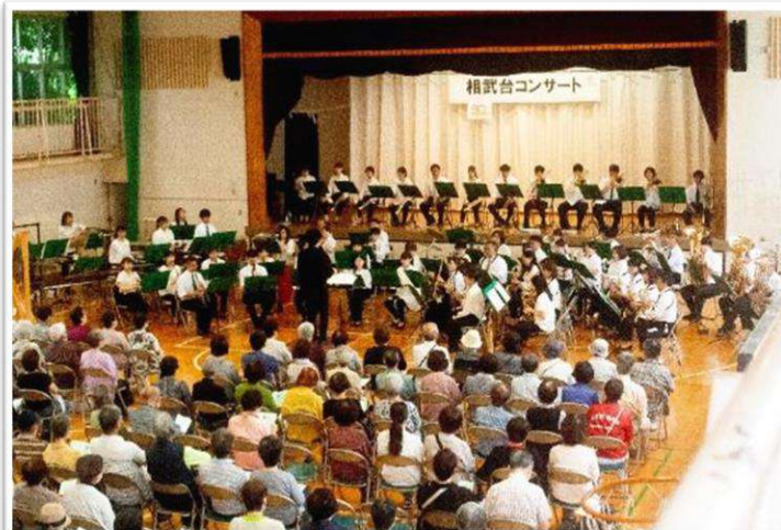
待ってました～～👏👏👏 盛大な拍手で会場が一体となり、コンサート開始