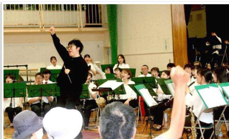
初夏を感じる暑さの中、素晴らしい演奏をありがとうございました！