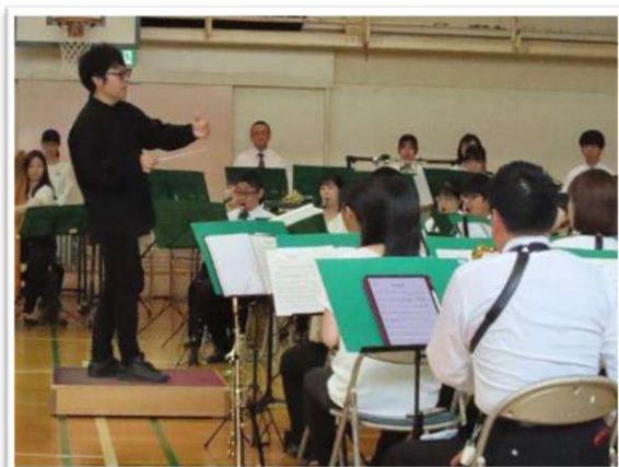
ダイナミックな指揮で、やわらかな音から力強い大迫力に音へと変化♪