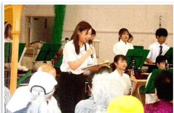
司会者の解説で、曲の理解も深まりました