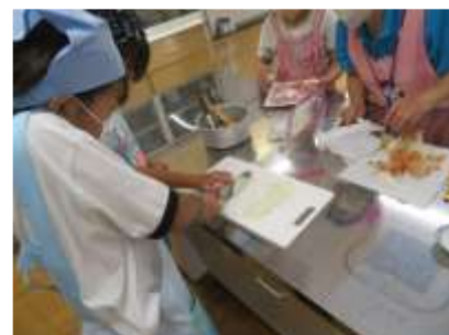
寒天デザートづくりの様子