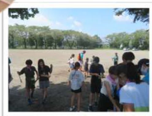
とても遠くまで水が飛び出していました。青少年部員のみなさんにも水がかかってしまいました！