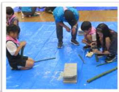
最初は不安そうでしたが、みんな上手に竹を切り、丁寧にやすりを掛けていました。