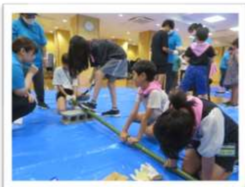
初めてののこぎりに、ドキドキ！